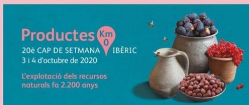
EXPOSICIÓ COMENTADA Plantes, roques i animals: l'explotació dels recursos de l'entorn a la Fortalesa d'Els Vilars