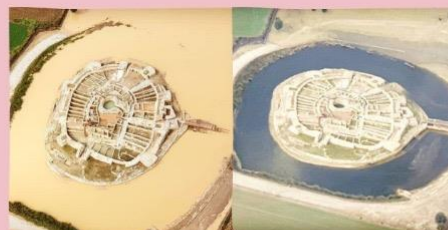
EXPOSICIÓ FOTOGRÀFICA Destrosses, imatges i lliçons de l'aigua. De la rubinada del Dana al Glòria (2019-2020)